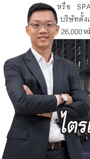
ไตรเตชะ ตั้งมติธรรม

อีกทั้งบริษัทมีแผนจะออกหุ้นกู้วงเงินมากกว่า 5,000 ล้านบาท แต่ยังคงพิจารณาการใช้เงินอีกครั้งภายหลัง เนื่องด้วยในปีนีจะมีหุ้นกู้ที่ครบกำหนด 5,200 ล้านบาท ซึ่งล่าสุดได้ออกหุ้นกู้ไปแล้ว 2,500 ล้านบาท โดยผลจากการที่ดอกเบี้ยลดลง ทำให้ต้นทุนทางการเงินของบริษัทในปีนีต่ำสุดตั้งแต่ก่อตั้งบริษัท เฉลี่ยลดลงอยู่ที่ 2.30%